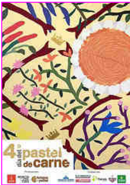
Cartel del año 2012

Ese mismo miércoles, justo después del desfile Murcia en Primavera se celebra en la Plaza Cardenal Belluga de la ciudad a las 8 de la tarde el Día del Pastel de Carne , donde varios de los más importantes pasteleros de Murcia reparten entre todos los asistentes un gran número del sabroso manjar murciano, acompañado de cerveza.