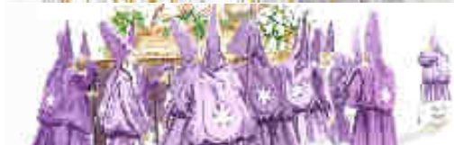
Acuarelas de Fernández Labaña

Es una Semana Santa llena de matices y muy diversa, puesto que disfruta de dos estilos diferentes de procesionar, uno de ellos totalmente exclusivo de Murcia: