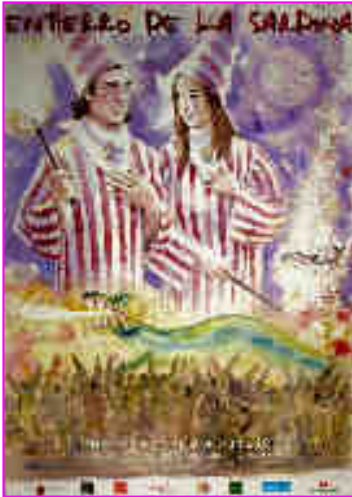
Cartel de Zacarias Cerezo para el año 2013

visita obligada a la ciudad. Se celebra el sábado siguiente a Sábado Santo.