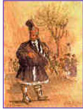
Dibujo de Jesús Asunción

XVIII, caracterizado por la especial indumentaria de estantes (nazarenos que portan los pasos) y mayordomos (nazarenos que rigen la procesión). Ambos llevan un capuz (forma murciana de llamar al capirote) corto y romo que no tiene la forma cónica habitual del resto de España y que deja el rostro al descubierto, contando con unas cintas de seda a ambos lados que hoy tienen una función decorativa pero que en la antigüedad servían para ajustar el capuz bajo la barbilla. Además, los estantes llevan la túnica recogida en la cintura formando un buche