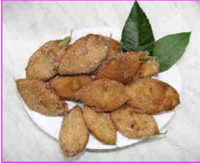
Paparajote, un dulce que envuelve a una hoja de limonero.