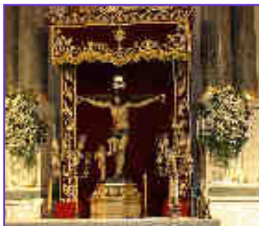
Cristo de la Sangre , Iglesia Parroquial del Carmen (Murcia) de Nicolás de Bussy, 1693