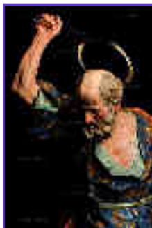
Detalle de El Prendimiento de Francisco Salzillo, 1763