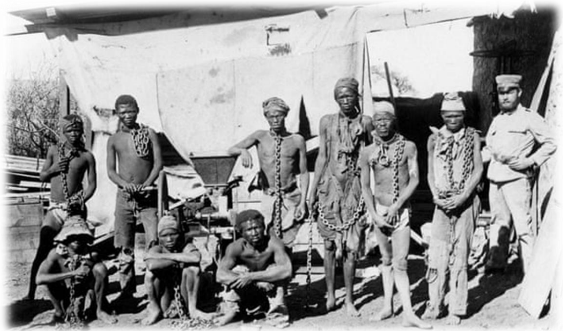
Un soldado, probablemente alemán, supervisando a prisioneros de Namibia entre 1904 y 1908

supuesta «mente nativa», que percibían como monolítica e inmutable. Este tema también es evidente en el caso de Gurnah. Si bien la violencia alemana solía conmocionar a la población local, ésta se producía muchas veces por cuestiones igualmente incomprensible: Paraiso relata, por ejemplo, cómo los alemanes «ahorcaron a algunas personas por razones que nadie comprendía». Sin embargo, a veces las referencias de Gurnah a ese «espectáculo» de violencia alemana también revelan cierta ironía. La exagerada fanfarronería de un askari en Afterlives, que se jacta de que todo el mundo debería temer a los «despiadados bastardos furiosos» de la fuerza colonial Schutztruppe y de que sus oficiales alemanes son «expertos prepotentes en el terror», no consigue impresionar mucho a Pascal, un africano perteneciente a una misión local.