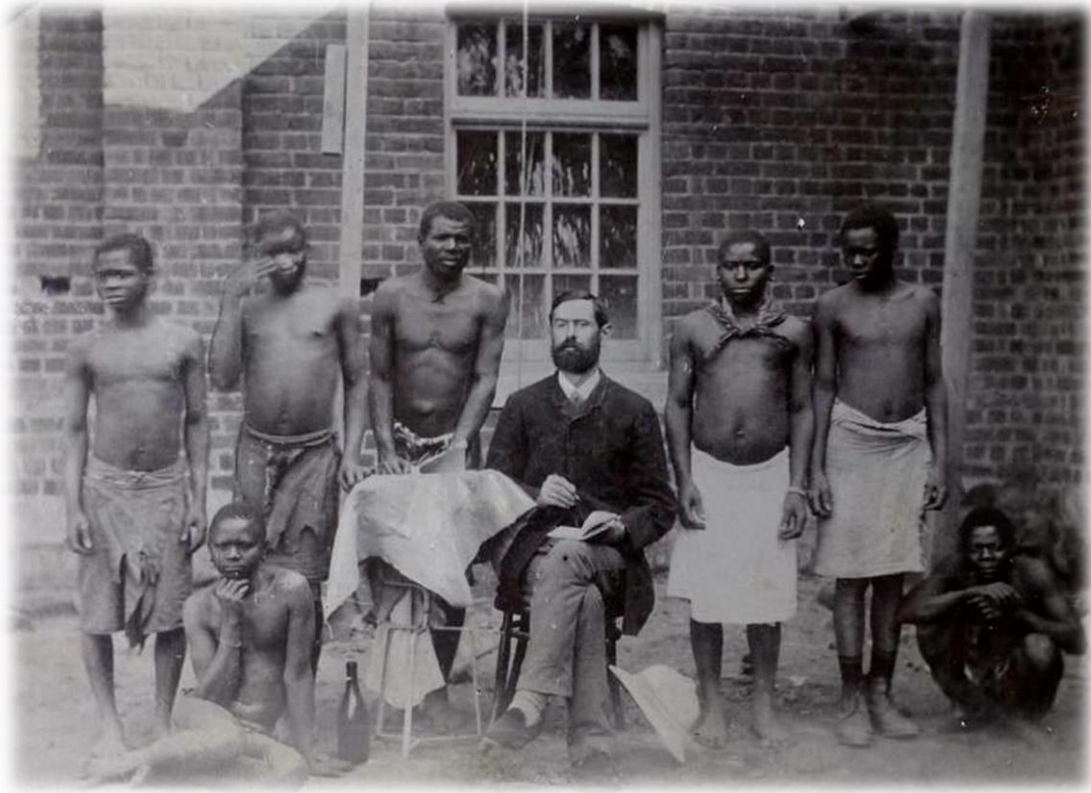
Colonizador alemán en África

Leer estas novelas solo como un tratado literario sobre la violencia colonial no les haría justicia. También ofrecen una rica visión de la vida de los pueblos colonizados. Gurnah, que nació bajo el dominio colonial británico en la isla de Zanzíbar, presta especial atención a la vida de la población costera y a sus influencias africanas, indias y árabes. En este entorno cosmopolita, el islam, como religión y visión del mundo, y el swahili, como lengua franca, eran con frecuencia los elementos de unión. Precisamente este cosmopolitismo ha llevado recientemente a esta región a la atención de la historia global, ya que muestra que la globalización no está impulsada exclusivamente por actores occidentales. Una densa red de conexiones a través del Océano Índico, la costa de África Oriental, el Cuerno de África, Madagascar, las Comoras, la Península Arábiga y la costa occidental de la India prevalecía aquí siglos antes de la colonización europea. Los comerciantes de Zanzíbar podían activar redes para pedir préstamos en la India, y los eruditos islámicos se movían libremente entre los distintos polos de este cosmos.