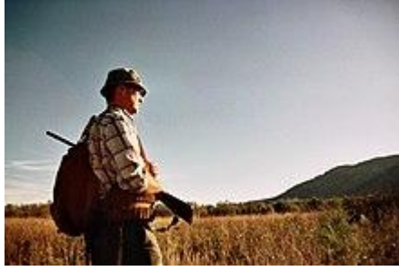
La caza, a la que Delibes era un gran aficionado, es un tema recurrente en sus obras.

En 1950 se inició una nueva etapa en la carrera literaria del escritor: tras sufrir un brote de tuberculosis, publicó El camino , su tercera novela, en la que narra el proceso que sufre un niño en el descubrimiento de la vida y de la experiencia ante la amenaza de dejar el campo y marchar a la ciudad, obra que constituye su consagración definitiva en la narrativa española de posguerra. Ese año nació su hija Elisa, licenciada en Filología hispánica y francesa.