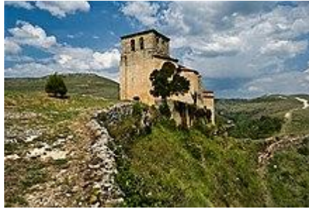
Iglesia de Santa María, en Sedano, pequeña localidad de la provincia de Burgos en la que veraneaba Delibes y que sirvió para ambientar muchas de sus historias.