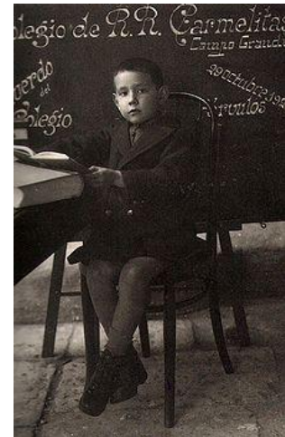
Miguel Delibes a los seis años de edad en una fotografía del Colegio de las Carmelitas de Valladolid.

Casa de la acera de Recoletos de la ciudad de Valladolid en la que nació Miguel Delibes el 17 de octubre de 1920. A la izquierda de la puerta hay una placa en la que se indica esta circunstancia, junto a la frase del autor: «Soy como un árbol que crece donde lo plantan».