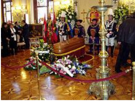
El féretro de Miguel Delibes en la capilla ardiente instalada en el salón de recepciones de la Casa Consistorial de Valladolid.

Durante los primeros días de marzo de 2010, su salud empeoró: el 11 de ese mes el escritor se encontraba ya en estado crítico, consciente pero muy sedado, y su familia comunicó el fallecimiento en cuestión de horas. La muerte de Miguel Delibes ocurrió finalmente en su domicilio vallisoletano a primera hora de la mañana del día 12, a los 89 años de edad, como consecuencia del cáncer de colon que se le diagnosticó en 1998 y del que no pudo recuperarse. Su capilla ardiente se instaló esa misma mañana en el salón de recepciones de la Casa Consistorial. Su funeral se ofició al día siguiente, 13 de marzo, por la mañana, en la catedral de Valladolid. A él acudieron numerosas personalidades como Lola Herrera, Concha Velasco, la vicepresidenta del Gobierno María Teresa Fernández de la Vega, el presidente de la Junta de Castilla y León Juan Vicente Herrera, o la ministra de Cultura Ángeles González-Sinde, entre otros, así como más de 18 000 personas.