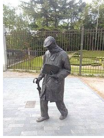
Estatua de Miguel Delibes en la entrada del Campo Grande de Valladolid.