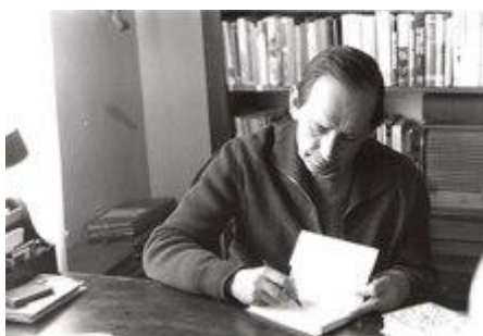
Miguel Delibes en su domicilio en 1975.

En la obra de Miguel Delibes hay un compromiso ético con los valores humanos, con la autenticidad y con la justicia social. Fue un escritor fiel a sus ideas y a su tierra castellana. La preocupación por las consecuencias negativas del progreso para la naturaleza y el hombre, por Castilla y la situación del campo castellano y por la