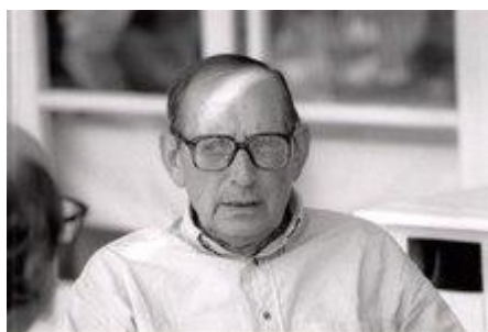
Delibes en julio de 1991 en El Escorial.

En 1980, el VII Congreso Internacional de Libreros, celebrado en Valladolid, rindió homenaje al escritor. El gran título de este periodo fue Los santos inocentes , publicado en 1981, radiografía social donde noveliza la degradación de una familia rural explotada por los caciques de la Extremadura rural. Al año siguiente recibió el Premio Príncipe de Asturias de las Letras, ex aequo con Gonzalo Torrente Ballester; participó en el Congreso «Una literatura para el hombre», celebrado en Reggio Emilia, Italia. Durante esta década, publicó libros sobre caza, cuentos, y recopilaciones de artículos de prensa. En 1983 fue investido doctor honoris causa por la Universidad de Valladolid. Al año siguiente, la Junta de Castilla y León le concede el Premio de las Letras y los libreros españoles le nombraron autor del año, recibiendo el Libro de Oro como reconocimiento. 25 A finales de año, Los santos inocentes fue adaptado al cine, recibiendo Alfredo Landa y Francisco Rabal, actores de la película, el premio a la interpretación en el Festival de Cannes. 26 En 1985 publicó El tesoro y fue nombrado