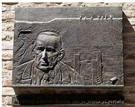
como homenaje por su novela El hereje .

Placa a Miguel Delibes instalada por la ciudad de Valladolid