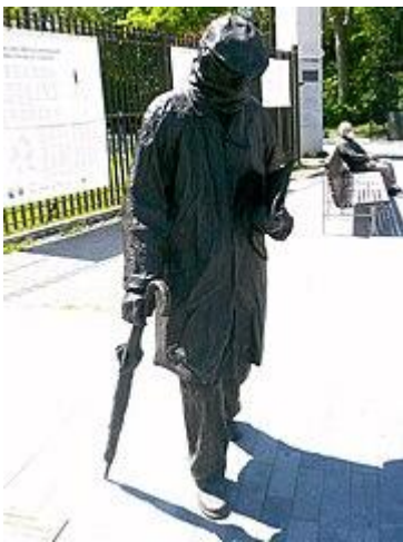
Estatua homenaje a Delibes en la Plaza de Zorrilla de Valladolid

técnica, lo hemos despojado de su esencia». 48 Sostiene que, en la antigua estructura rural, el hombre estaba dedicado a tareas mucho más humanas, lejos de la masificación ciudadana, manteniendo sus rasgos individualizadores y ostentando una personalidad irrepetible. «...mis personajes se resisten, rechazan la masificación. Al presentárseles la dualidad Técnica-Naturaleza como dilema, optan resueltamente por ésta que es, quizá, la última oportunidad de optar por el humanismo. Se trata de seres primarios, elementales, pero que no abdican de su humanidad; se niegan a cortar las raíces. A la sociedad gregaria que les incita, ellos oponen un terco individualismo». En el señor Cayo, su personaje, un anciano a punto de cumplir ochenta y tres años, quedan representados los valores culturales de esa tradición milenaria que se encuentra en trance de desaparecer. El disputado voto del señor Cayo es una elegía dolorida ante la desaparición de la cultura rural en España, creada a través de los siglos, y que, en poco tiempo, ha sido barrida y sustituida por la industrial: «Hemos matado la cultura campesina pero no la hemos sustituido por nada, al menos, por nada noble».