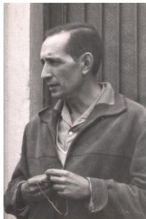
Miguel Delibes en la década de 1960 en su «refugio» burgalés de Sedano.