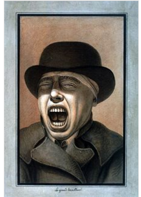
Imagen de portada de Cuentos únicos (volumen 25 de la colección El Ojo sin Párpado , Siruela, 1989). 47