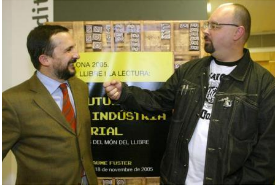
Carlos Ruiz Zafón con el autor de este artículo, en un acto del Año del Libro y la Lectura 2005