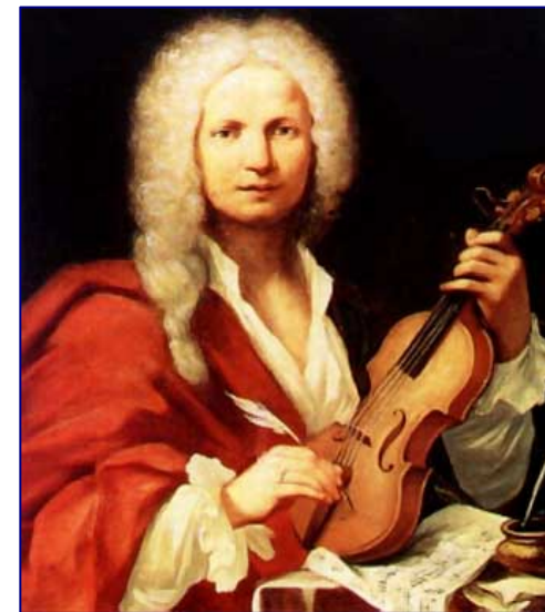
Antonio Lucio Vivaldi (1678-1741)