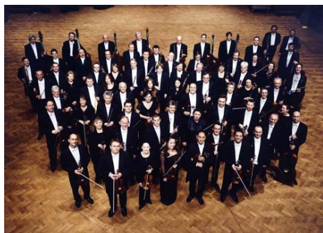
London Symphony Orchestra

La combinación de números y letras separadas por espacios es la SIGNATURA y sirve para saber en qué lugar de la biblioteca están colocados habitualmente los documentos.