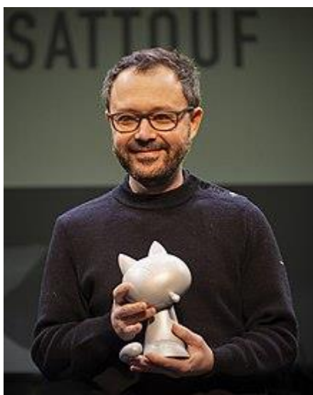
Sattouf recibe el Gran Premio de la Ciudad de Angulema (2023).