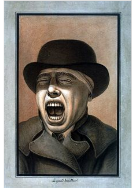
Imagen de portada de Cuentos únicos (volumen 25 de la colección El Ojo sin Párpado , Siruela, 1989). 47