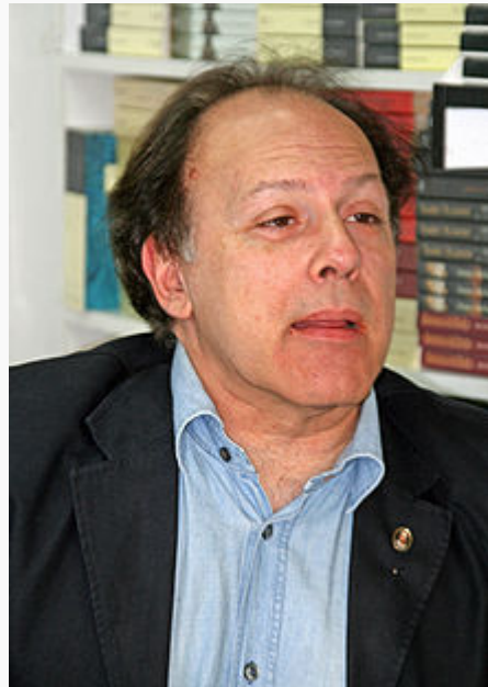
Javier Marías firmando en la Feria del Libro de Madrid en 2008