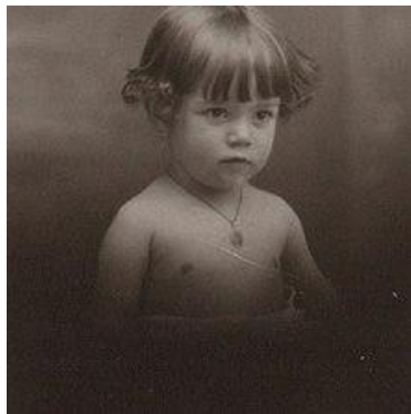
Retrato infantil de Carmen Martín Gaité.