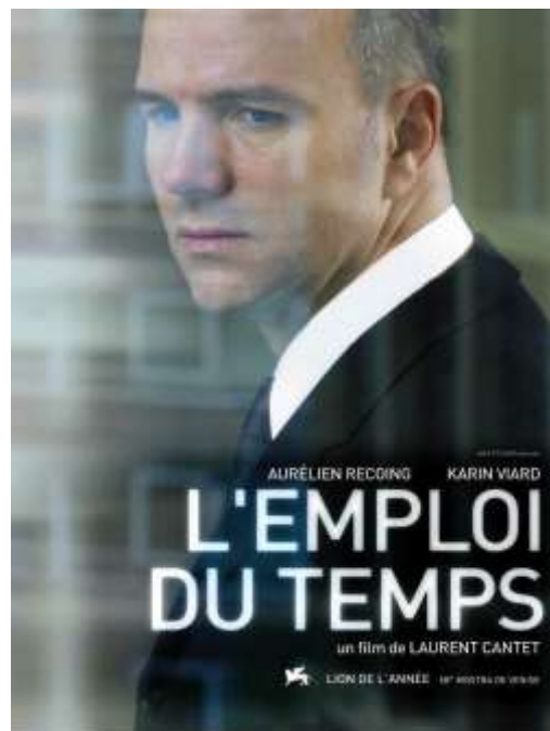
El empleo del tiempo (Laurent Cantet, Francia, 2001)